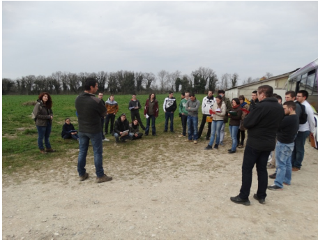
Figure 3 : Des étudiants en visite chez un agriculteur qui s'investit dans leur formation

l'investissement des professionnels agricoles dans les activités pédagogiques de la formation et celui des enseignants dans les projets de la ferme.